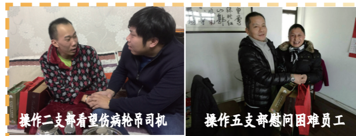
操作二支部看望伤病轮吊司机