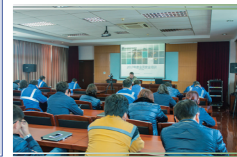
2月27日，公司举行全员安全培训。

3月3日上午，公司召开了2016-2017年后备人才培养中途推进会，公司党政领导、后备人才工作小组成员、各党（总）支部书记、后备学员及带教师傅代表出席了会议，会议总结了2016年后备人才培养的总体情况、存在的主要问题，并布置了后续工作计划。（人事）