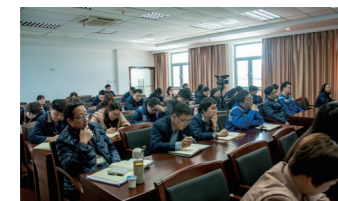
▲ 部室联合员工认真学习本次形势任务宣讲，进一步认识下一阶段的工作重心和主要任务。