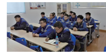
▲ 工程技术部员工认真学习宣讲内容，认清形势、明确任务。